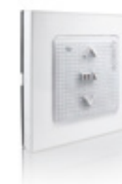
Smooove Origin io