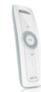
Situo Vario 1