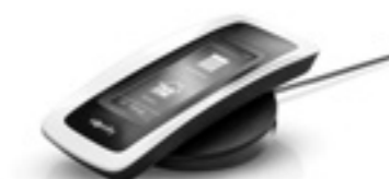
Nina io Z